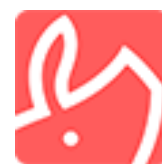
くりふ豚 アイコン

URL： https://play.google.com/store/apps/details?id=jp.gl3inc.Crypton