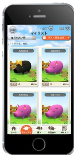
くりふ豚 プレイ画面