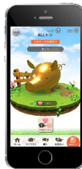
くりふ豚 プレイ画面

「くりふ豚」は、ユーザーが豚のキャラクター「くりふトン」をコレクションし、交配させ新種を誕生させたり、ユーザー間での取引が可能なゲームです。最大の特長は Dapps としてゲームを構築している点で、イーサリアムのブロックチェーンを活用しており、仮想通貨イーサを扱ったブロックチェーンゲームとなります。2018年6月18日の配信開始以来、多くのユーザーにプレイいただいております、これまで累計 10,000 匹以上の「くりふトン」が誕生しております。