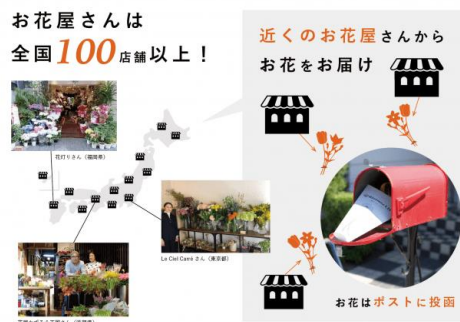
全国各所の最適な花屋からお届け

直近では法人ユーザー向けサービス「Bloomee Box」を展開し、店舗やクリニックをターゲットとして、チャンネル拡大を目指しております。